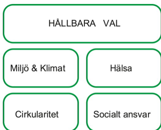
Figur 3 De fem prioriterade hållbarhetsområden som är grunden för hållbarhetsstrategin 2033