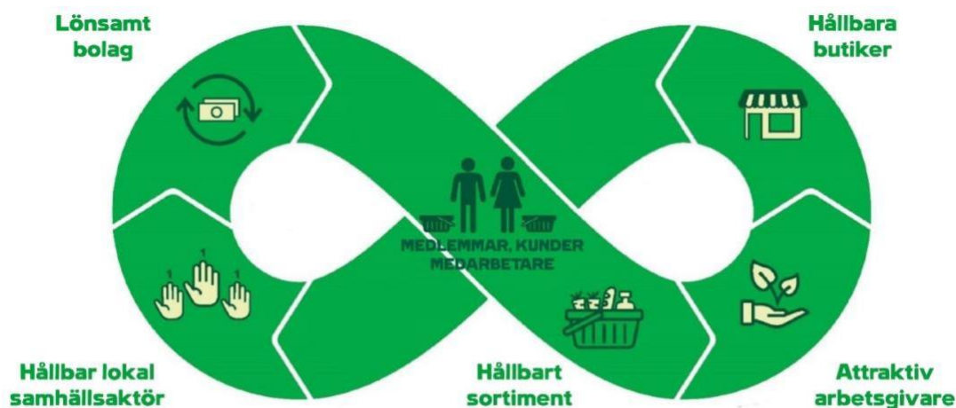
Figur 4 De fem prioriterade hållbarhetsområden som är grunden för CBS hållbarhetsstrategi.

Vi strävar efter att erbjuda våra medlemmar och kunder bästa pris på kvalitet, hållbarhet och hälsosamma alternativ samt att göra det enkelt att göra hållbara val. Hållbarhet ska vara fullt integrerat i vår verksamhet. De fem prioriterade hållbarhetsområdena som utgör grunden i strategin och vår strävan mot hållbar utveckling beskrivs i figur 4.